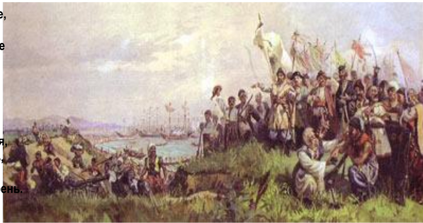
А.А. Чечин. Высадка казаков на Тамань.

Стоял мой предок на кургане, Смотрел вокруг из-под руки. Плескались волны на лимане Орел чертил свои круги. И не одной души в округе Цикады нарушали тишь. Земля, не тронутая плугом, Качала травы и камыш. Потом к воде казак спустился, Кушак и шапку бросил в тень, Напился и перекрестился... И вдруг представил свой курень. Он думал:»Добрая пшеница Уродится на целине... И в хатках беленьких станица Ему явилась как во сне.